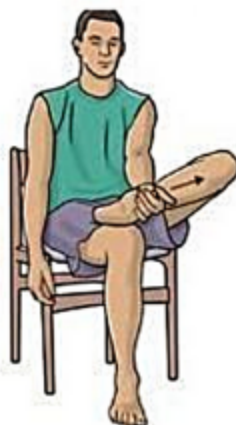
растяжка подошвенной фасции сидя