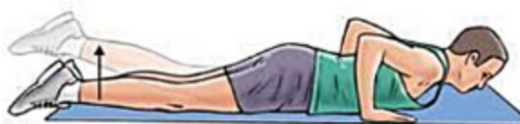
разгибание бедра лежа