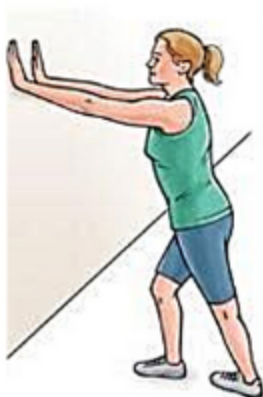
Растяжка голени у стены стоя