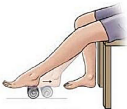
упражнение с холодной банкой